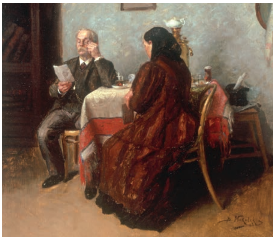
La carta, de Vladimir Iegorovitx Makovski.

El cas misteriós del doctor Jekyll i el senyor Hyde Bromera